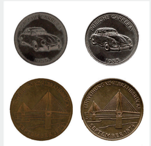
Escaneado 2D vs 3D, se capturan detalles