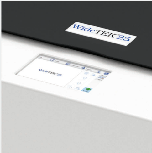
Pantalla de buen tamaño para facilitar la operación

El escáner se puede operar desde cualquier navegador estándar, mediante la pantalla táctil incorporada, o desde un dispositivo móvil como iPad o tableta Android usando nuestra aplicación para dispositivos móviles Scan2Pad®.